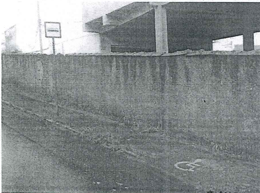
Avenida dos Salgueiros em frente ao nº 180.

CÂMARA MUNICIPAL DE MARIANA APROVADO POR UNANIMIDADE