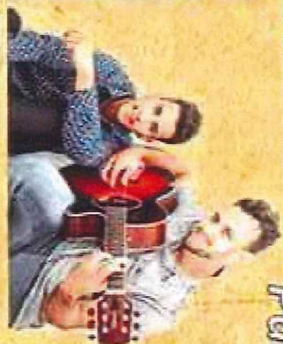
RIGOR & THIAGO