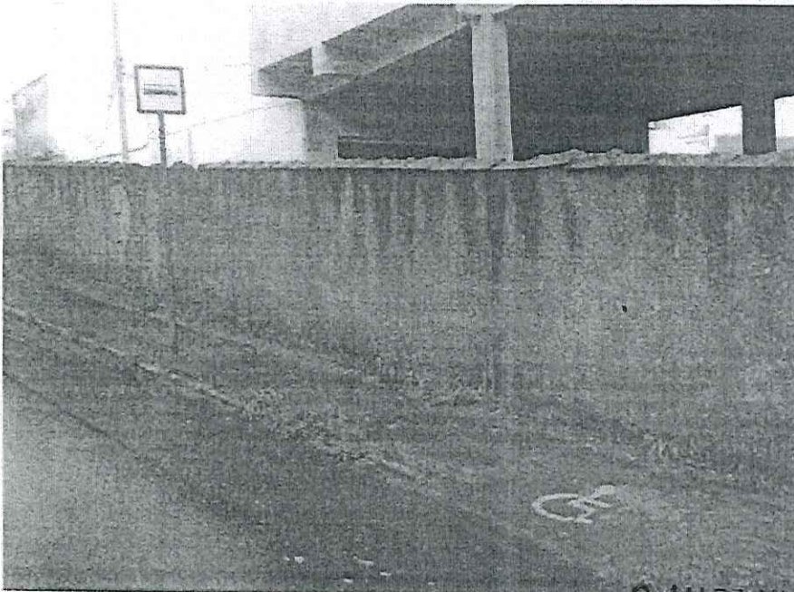
Avenida dos Salgueiros em frente ao nº 180.

CÂMARA MUNICIPAL DE MARIANA APROVADO POR UNANIMIDADE