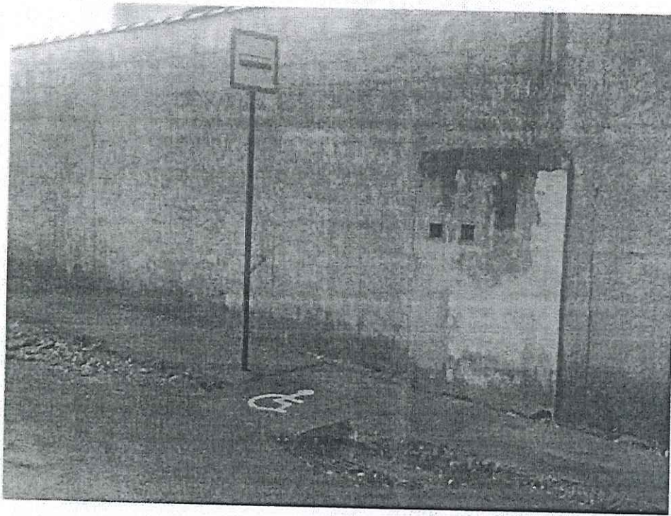
Rua das Acácias em frente ao nº 351.

Telefone: (31) 3557-4175 Email: zesalesvereador@gmail.com