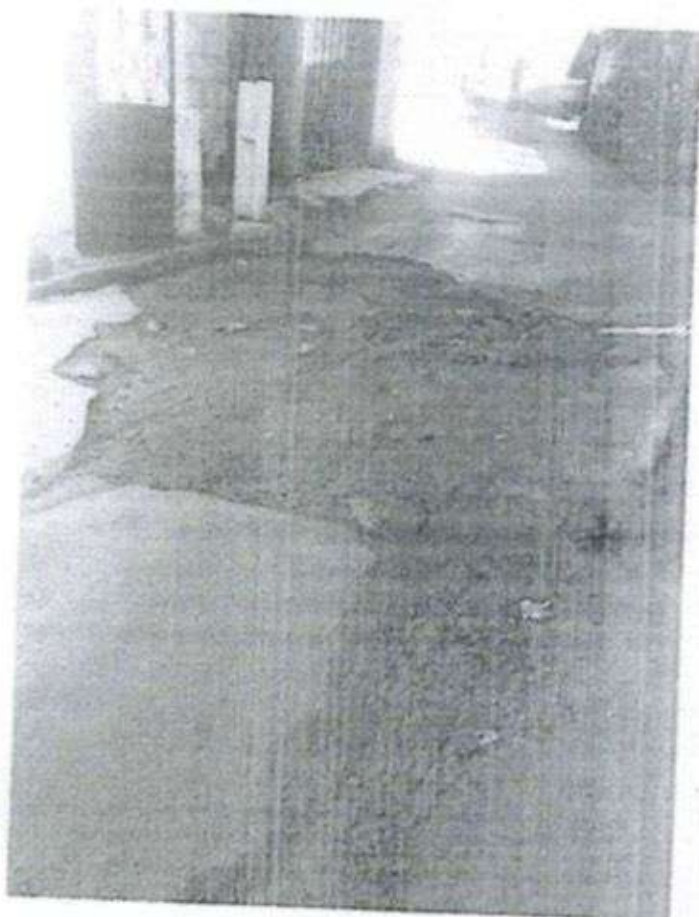
Rua Fábrica Velha